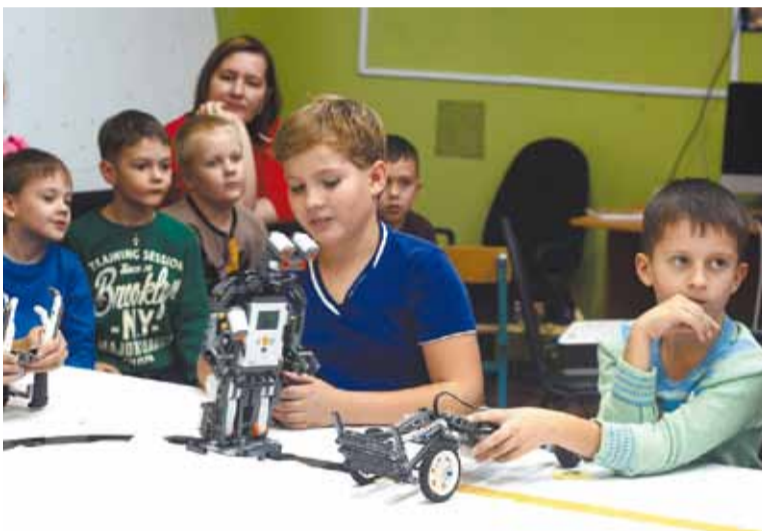
Роботы выходят на дуэль.