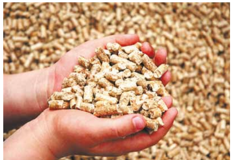
Полосы подготовила Евгения ЧЕРНОВА

Стараемся помочь всем, ищем возможности, чтобы члены профсоюза могли отдохнуть». В настоящее время, несмотря на почтенный возраст, завод чувствует себя хорошо, хотя новые экономические условия диктуют иные условия работы.